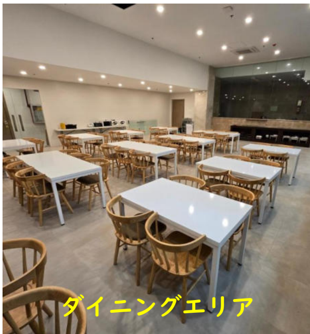
ダイニングエリア