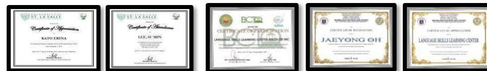
ボランティア活動証明書

USLSは韓国、中国、日本、台湾、ベトナム、タイの50以上の大学と提携しており、毎年1,000人以上の学生を受け入れています。