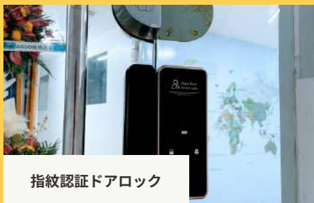
指紋認証ドアロック