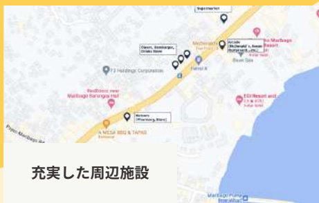
充実した周辺施設