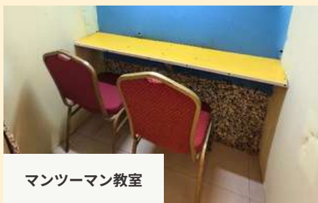
マンツーマン教室