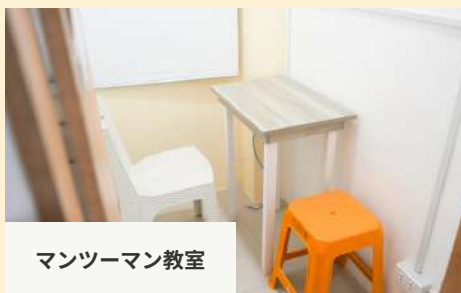
マンツーマン教室