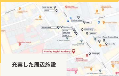
充実した周辺施設