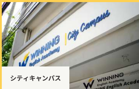
シティキャンパス