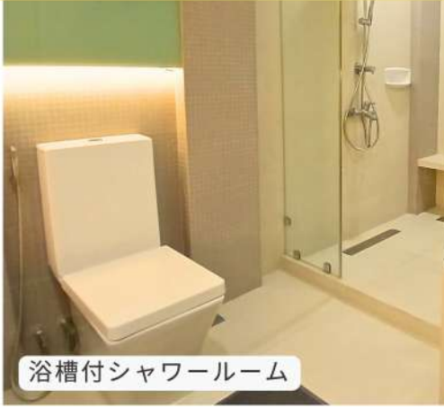
浴槽付シャワールーム