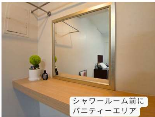
シャワールーム前に バニティーエリア