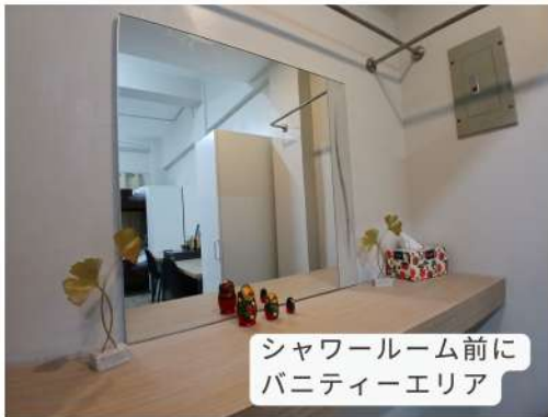
シャワールーム前に バニティーエリア