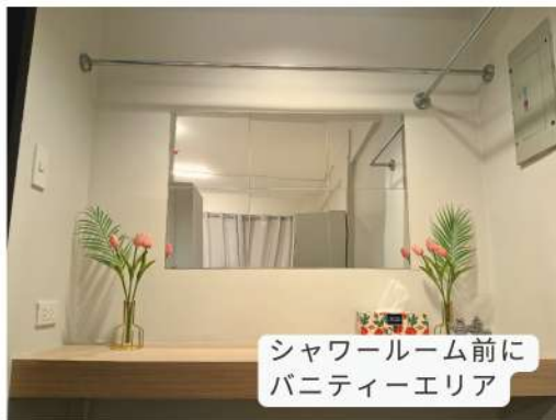
シャワールーム前に バニティーエリア