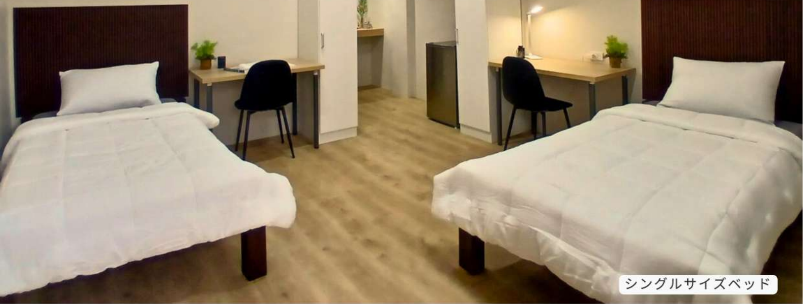
シングルサイズベッド