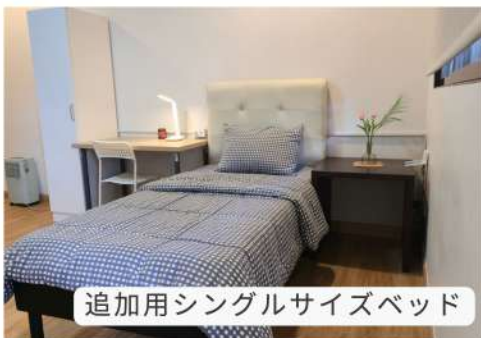
追加用シングルサイズベッド