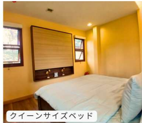
クイーンサイズベッド