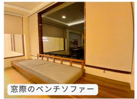
窓際のベンチソファ