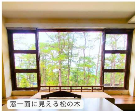
窓一面に見える松の木