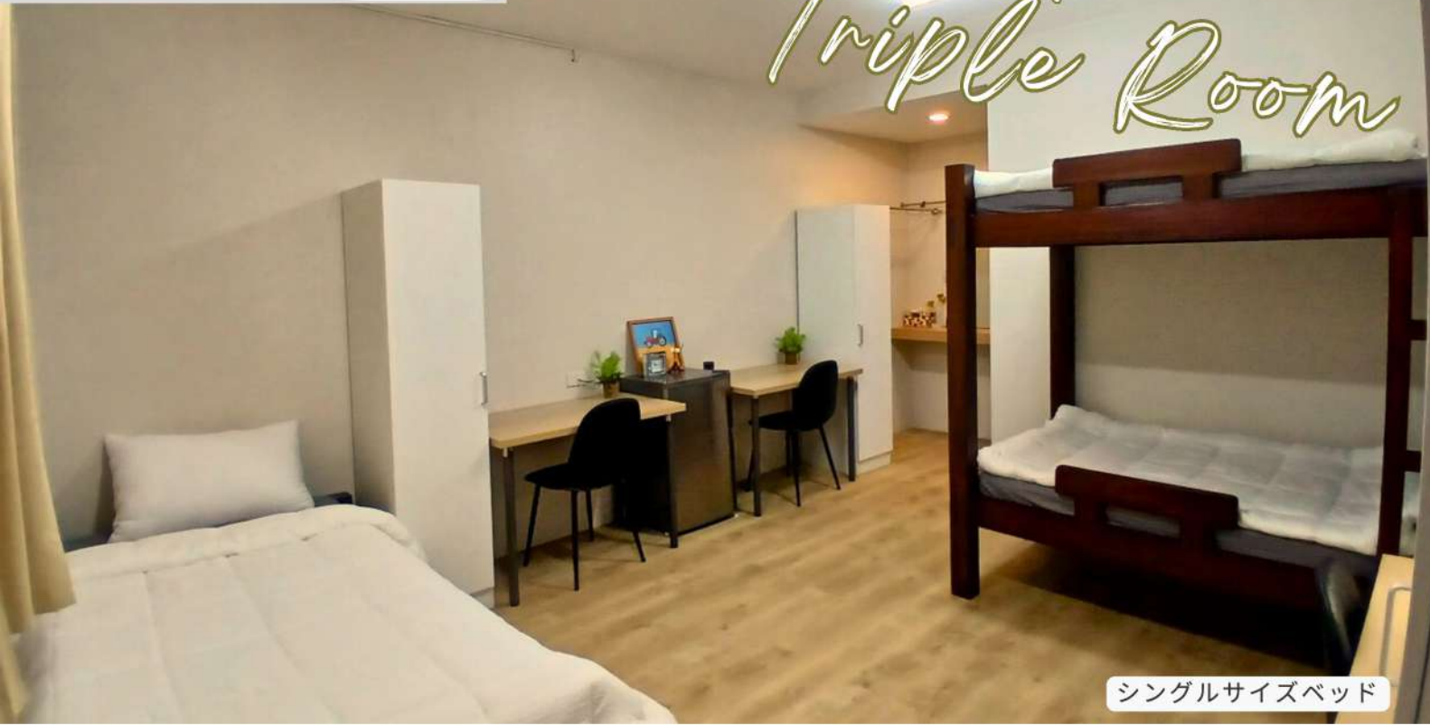
シングルサイズベッド