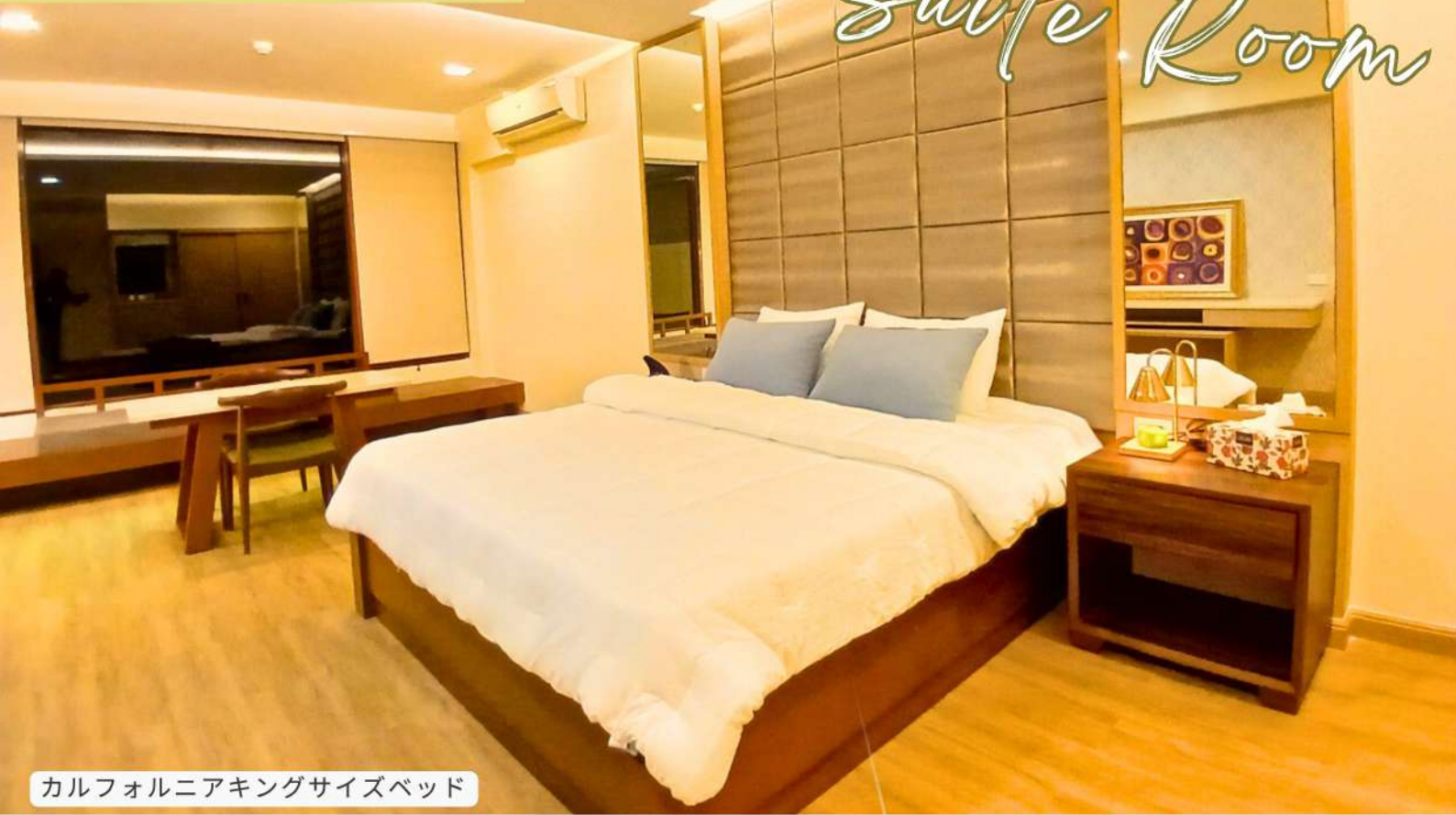
カルフォルニアキングサイズベッド