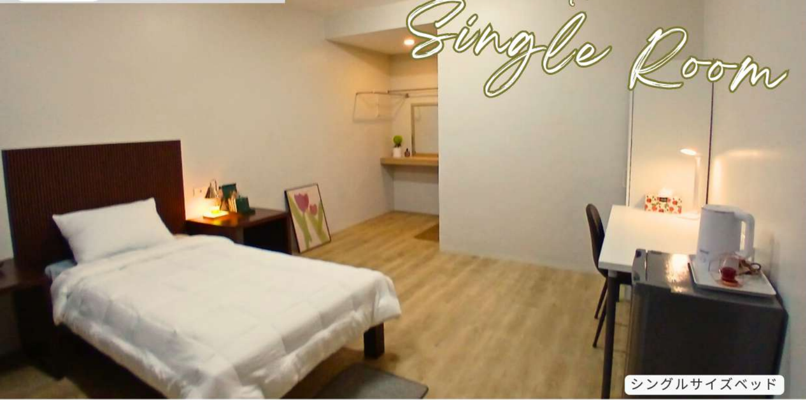
シングルサイズベッド