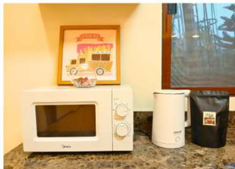
Microwave & Electric Kettle