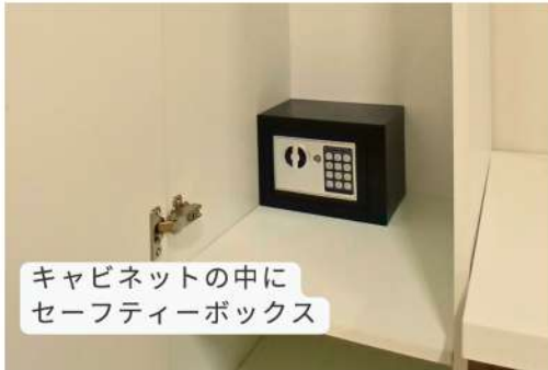
キャビネットの中に セーフティーボックス