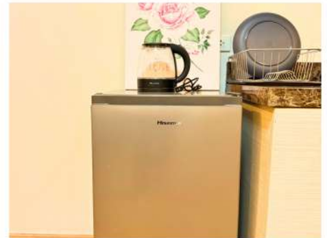
Fridge & Electric Kettle