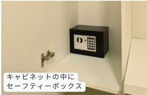
キャビネットの中に セーフティーボックス