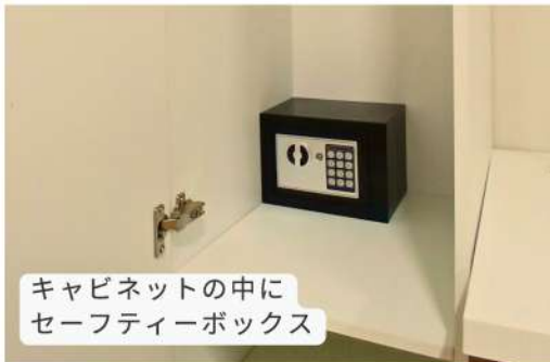
キャビネットの中に セーフティーボックス