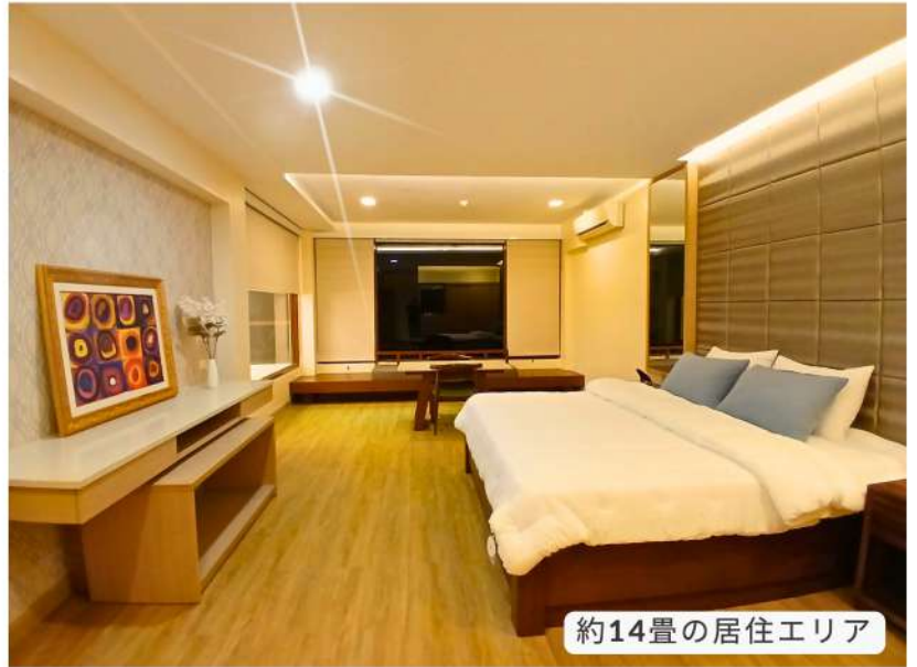
約14畳の居住エリア