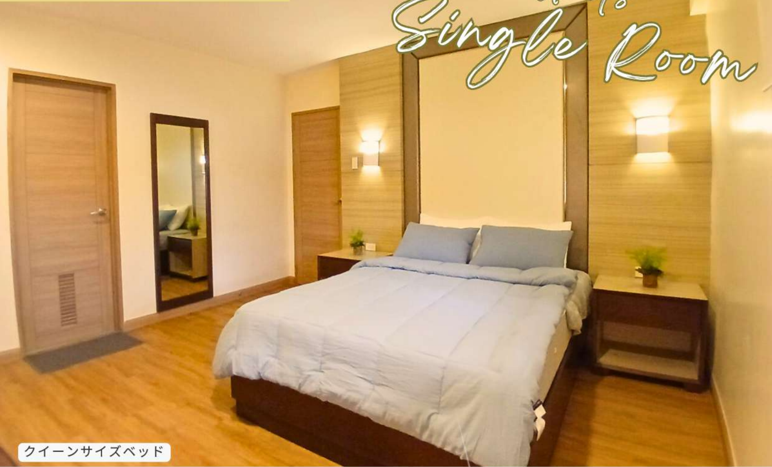
クイーンサイズベッド