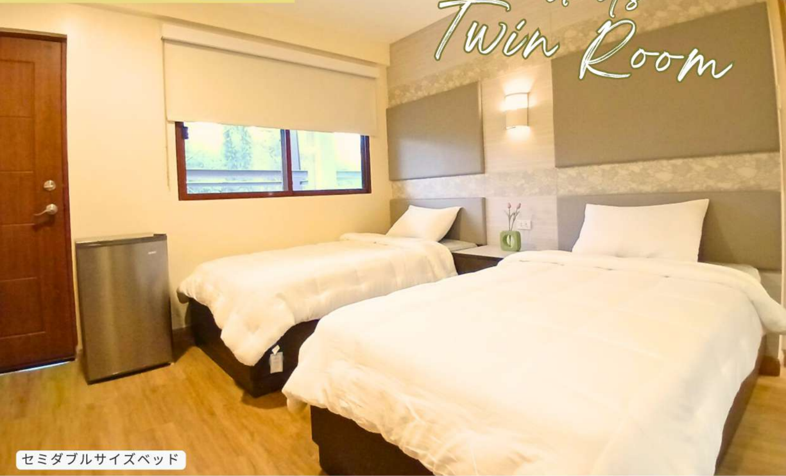
セミダブルサイズベッド