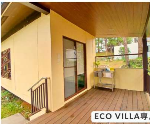
ECO VILLA専用ウッドデッキ