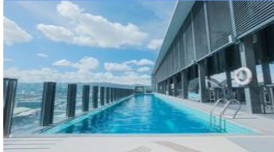
タオル無料貸し出し