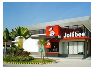
<ホテルから見たショッピングセンター >