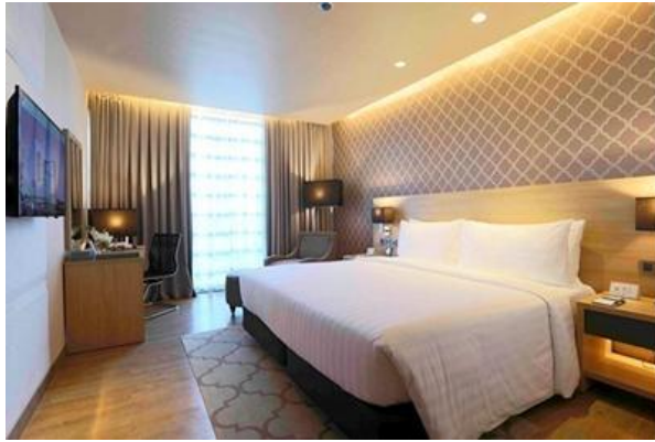
デラックスルーム(1ベッドルーム キングサイズベッド) 約27㎡