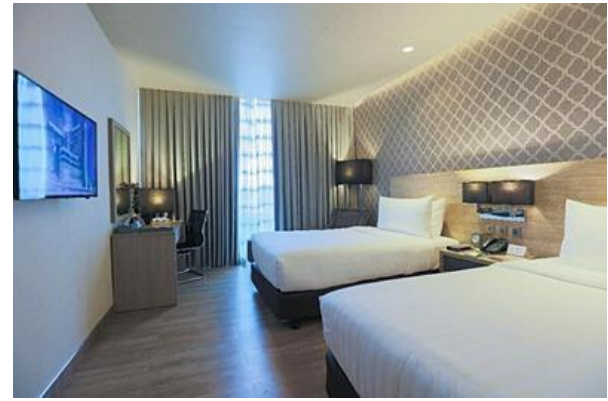
デラックスルーム(2ベッドルーム ダブルサイズベッド)約27㎡