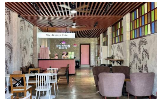
▲学校から徒歩3分のカフェ