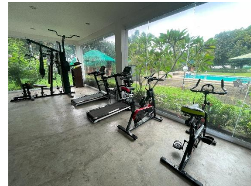
▲キャンパス内のジム