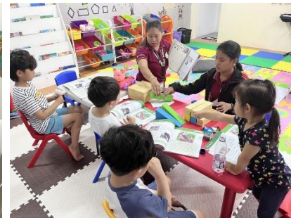
▲幼稚園での授業風景