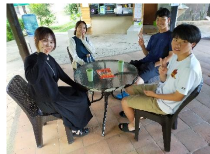
▲高校生単独の生徒様たち