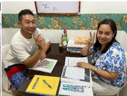
▲中高年~シニアの生徒様も多い