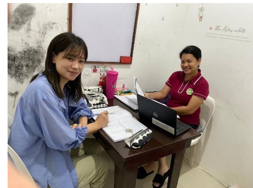
▲マンツーマン授業 ▼学食はバイキング