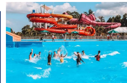
▲アジア最大級のウォーターパーク